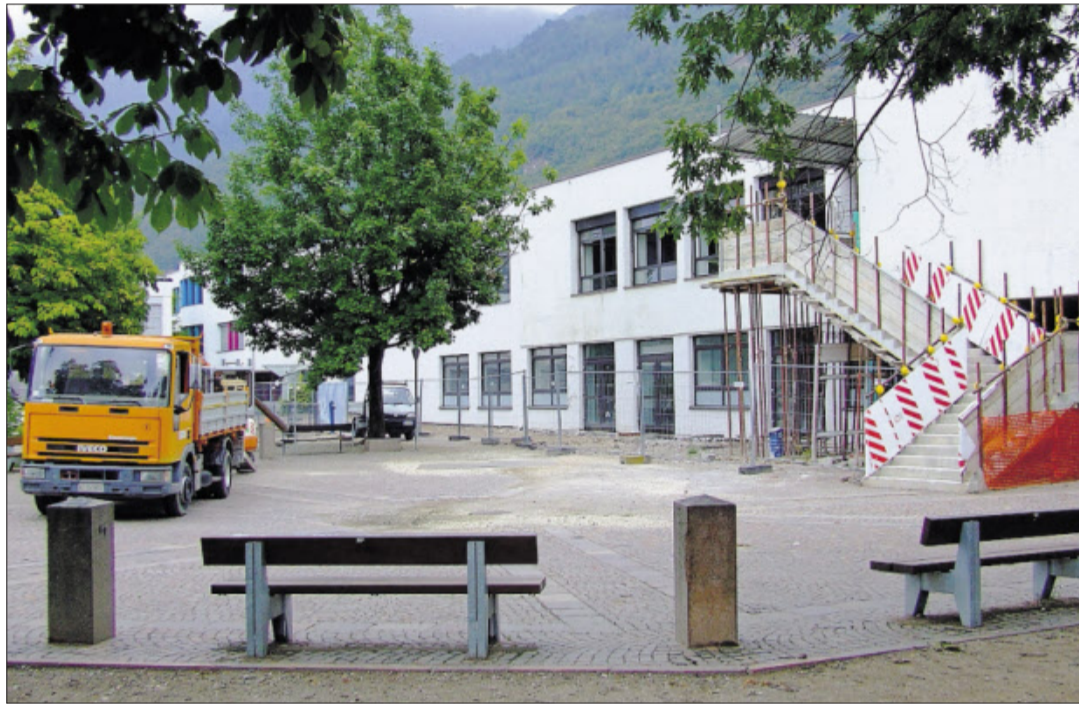
Immer noch Baustelle: Die Fertigstellung der neuen Leiferer Schulmensa ist mehr als überfällig.